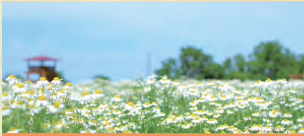
カモミール 5月16日～6月14日