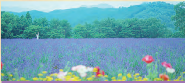
ラベンダー 6月13日～7月12日