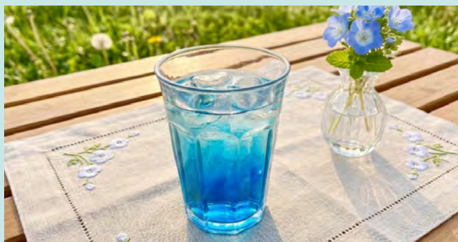
ネモフィラゼリードリンク