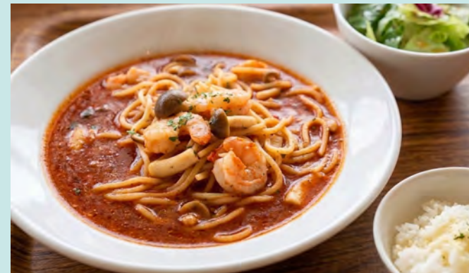
えびときのこのトマトスープパスタ セット (サラダ・小ライス付)