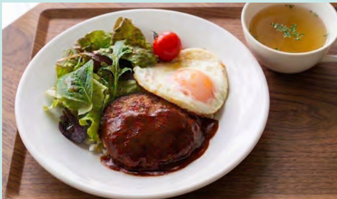
ロコモコ丼セット (スープ付)