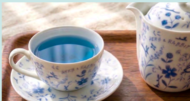
ハーブティー (バタフライピー&レモングラス)