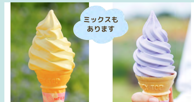
カモミールソフト ラベンダーソフト